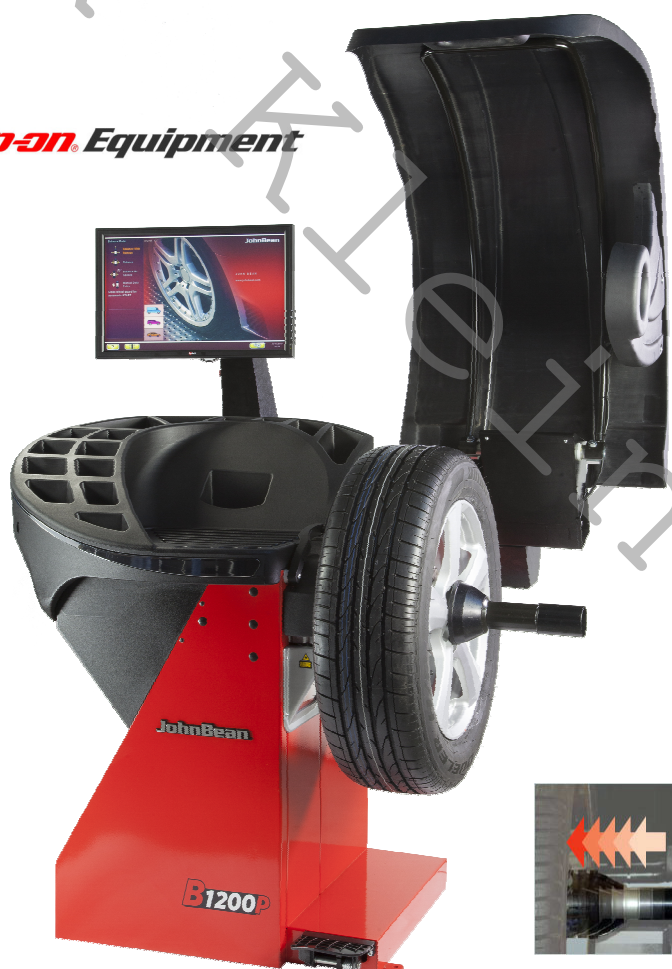
Smart Sonar pro šířku disku