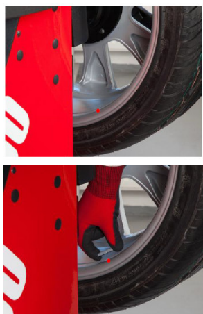
Laser pro lepící závaží